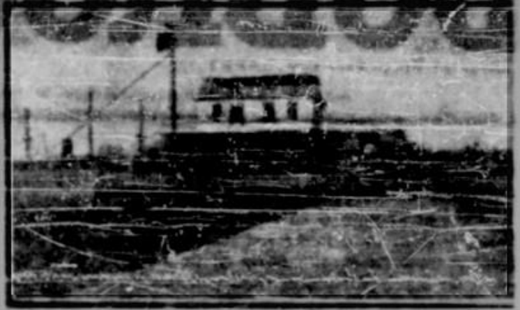
Pavilionul regal din portul Constanța