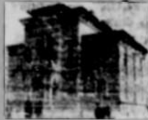
Constantza Palatul Poștelor

În această ordine de idei, facem trista constatare, că metropola Dobrogei este lipsită de o revistă literară care să propage scriburile populației dobrogeane. Nu putem spune că ducem lipsă de scrierile elementare. Cu atât mai mult, cu cât o bună parte din scrierile dobrogeane și-au câștigat „dreptul la viață”. Suntem în pragul sezonului literar și nici un semn de viață, nici un fel de mișcare în sferile literare dobrogeane. A detarmat și tînăra generație în lăsa nepăsării ce ne a cuprins pe toți.