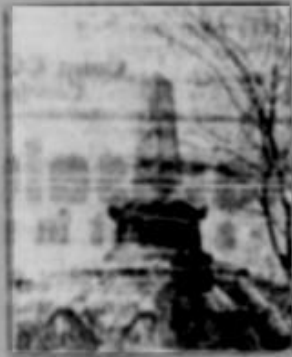
Constantza Monumentul eroilor francezi